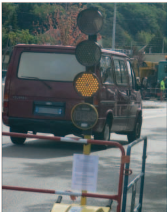
Pour réguler la circulation, des feux provisoires ont été installés.