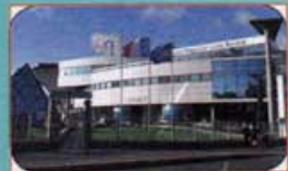
Centre Léon BERARD Service relations Donateurs 28, rue Laënnec 69373 LYON CEDEX 08

Les participants à cette randonnée sont invités à faire un don pour la recherche contre le cancer (Chèque à l'ordre de « Anim'Montbernier » qui reversera les dons aux 2 hôpitaux ou espèces dans une enveloppe fournie, avec coordonnées ou anonyme)