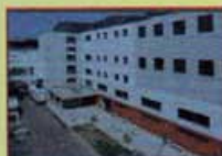
Centre Hospitalier Lyon Sud Pavillon Marcel Bérard 1G 165, chemin du Grand Revoyet. 69495 Pierre Bénite

Anim'Montbernier Les bénévoles de Ruy-Montceau organisent, en partenariat,